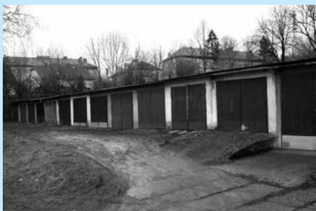
Działka na sprzedaż w rejonie ul. Mickiewicza zabudowana garażem parterowym.

Wykaz nieruchomości przeznaczonych do zbycia został wywieszony na tablicy ogłoszeń Urzędu Miejskiego w Cieszynie (Rynek 1, I piętro) na okres od 17 września 2013 r. do 8 października 2013 r.