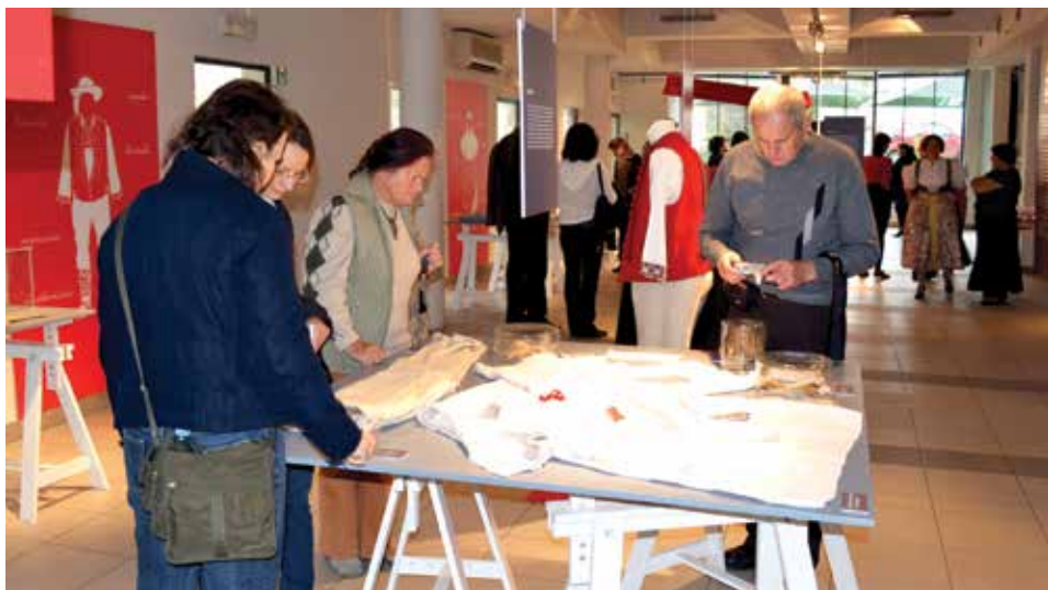
Wystawa pokazuje, że tradycja szycia strojów ludowych na Śląsku Cieszyńskim jest wciąż żywa.

Wystawa Hoczki, żywotki, kabotki... i inne wątki strojem pisane pozwala podejrzeć, jak powstają stroje, pokazuje tradycyjne materiały, z których szyto kiedyś i tkaniny wykorzystywane współcześnie. Zdradza, skąd biorą się najpiękniejsze wzory istebniańskich hafciarek i jak rozpoczyna się haft na żywotku. Pokazuje, że tradycja szycia strojów ludowych na Śląsku Cieszyńskim wciąż jest żywa”.