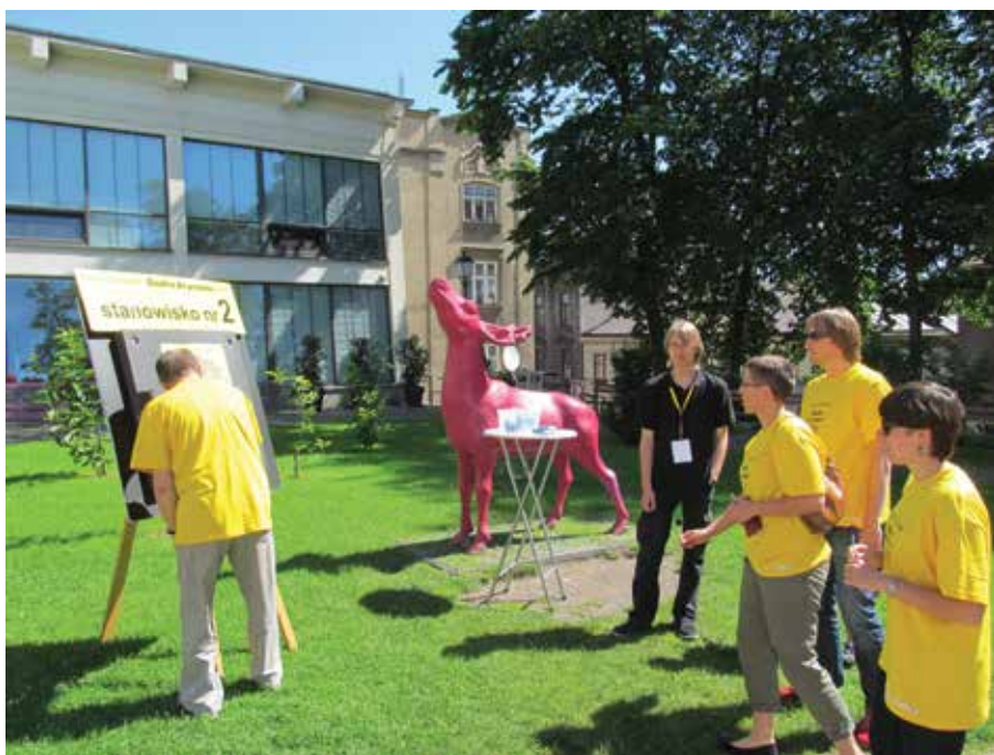
7 października o godz. 20.20 na antenie TVP Katowice widzowie zobaczą jak cieszyńska drużyna wypadła w konkursowej rywalizacji.

– zwycięska gmina otrzyma pięciominutowy, profesjonalny film promocyjny przedstawiający swoje miasto.