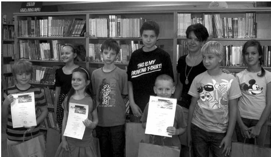
Najaktywniejsi młodzi czytelnicy zostali wyróżnieni przez Bibliotekę Miejską.

Biblioteka Miejska w Cieszyń, wzorem innych bibliotek w Polsce i za granicą, łączy w sobie i z powodzeniem realizuje funkcje księżnicy, ośrodka kultury i edukacji oraz centrum informacji multimedialnej. Nie brakuje więc użytkowników Biblioteki, którzy odwiedzają ją nie tylko w poszukiwaniu książki, ale chętnie sięgają też do bogatej oferty usług oferowanych przez BM.