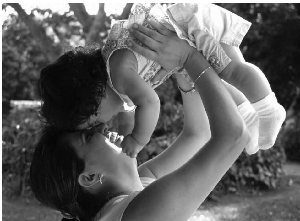
Dom Matki i Dziecka „Słonecznik” wspiera kobiety, które doświadczają trudów i radości wychowania małego człowieka.

Program pobytu dostosowywany jest indywidualnie do potrzeb i sytuacji życiowej kobiety. Zakłada realizację szczegółowych zadań zmierzających bądź do pełnego usamodzielnienia, bądź do powrotu do rodziny i nawiązania nowych relacji opartych na wzajemnym szacunku. Czas pobytu także jest dostosowany indywidualnie, nie jest jednak dłuższy niż rok. Wyjątkowo może