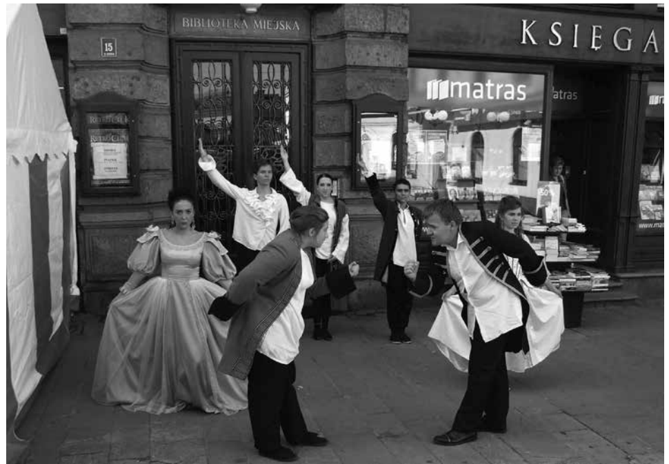
Na ul. Głębokiej zainscenizowano fragmenty „Zemsty” oraz publicznie czytano teksty hrabiego Fredry.